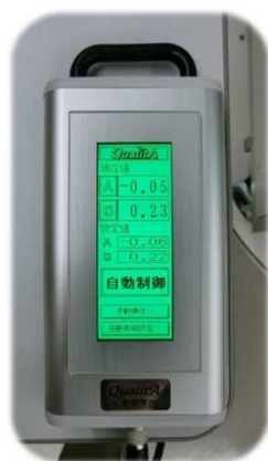
タッチパネル操作器