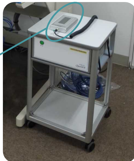
コントロールボックス(操作室に設置)