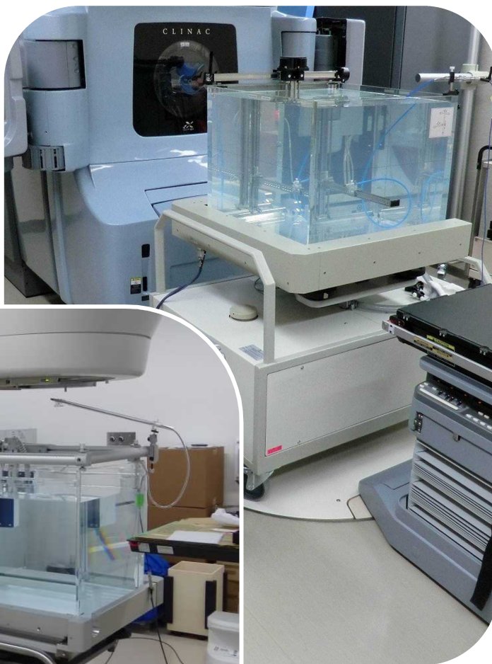
3次元水ファントムへの装着例