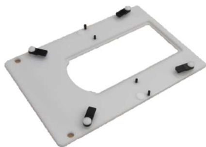
E-プレート(樹脂製) EP-04 (製造販売届出番号 20B1X10005000023)