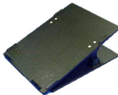
E-フレーム固定プレート用傾斜台