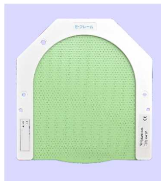
頭部用グリーンシェル ESG-01