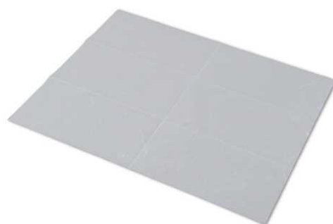
スーパー離型シート