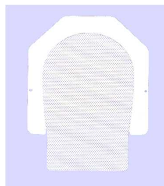
頭頸部用シェルロング ES-03